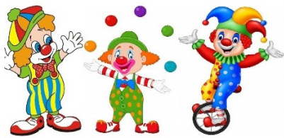
Кабалевский Д.Б. «Клоуны» лебедей»