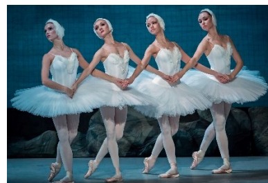
П.И.Чайковский «Танец маленьких